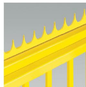
Ved behov kan porten leveres med «Anti-climb spikes»